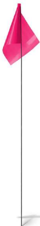
Conditionnement : Carton de 100 drapeaux de même couleur